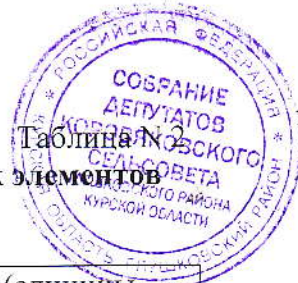
Таблица № 2 Действительная восстановительная стоимость кустарников и других элементов озеленения (СКК), единицы, кратные МРОТ